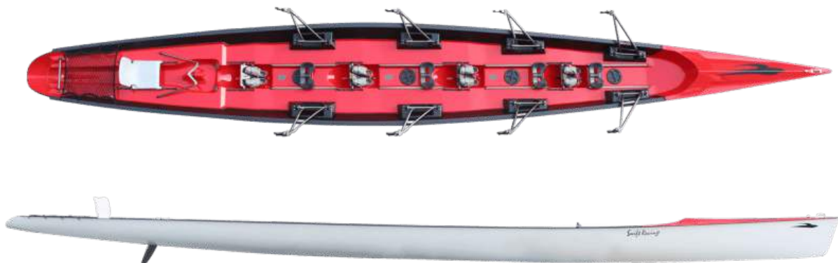
Swift Coastal 4X+

De coastal rowing boot heeft een aflopende romp van boeg naar stuur, waardoor eventueel binnendringend water via de achtersteven weer naar buiten kan stromen. De achtersteven bevindt zich vrijwel op dezelfde hoogte als de waterlijn. Een terugslagklep aan de achtersteven voorkomt dat er water in de boot komt tijdens het roeien met de wind in de rug en bij het neerlaten van de riemen. Tijdens het transport van de boot dient de klep vergrendeld te worden.